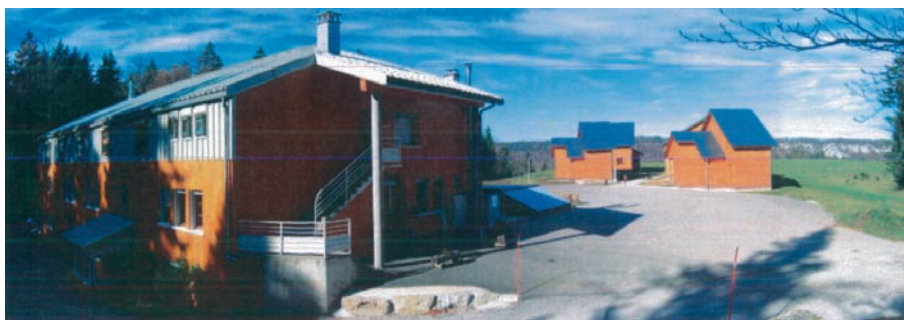
Centre de Loisirs Prémonval, 440 Chemin Bec de Peroseys 39220 PREMANON tél. 03 84 60 78 07 - centre.premonval@free.fr

N'hésitez pas à appeler pour bénéficier de toutes les informations nécessaires à l'inscription de vos enfants.