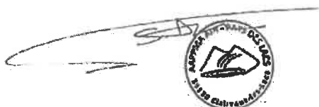
Ain-Pays des Lacs

Nous vous remercions de votre engagement à entretenir la bonne entente entre usagers de nos milieux aquatiques afin de faire perdurer puis développer les parcours de la pêche de la carpe de nuit.